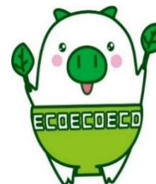
福岡県広報部長 「エコトン」

TEL:052-890-9055 FAX:052-890-9056 E-mail:nagoya-o@pref.fukuoka.lg.jp