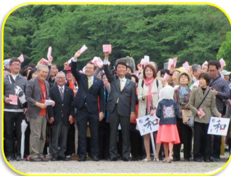
●人文字に加わりドローン撮影に参加する小川知事（写真中央）