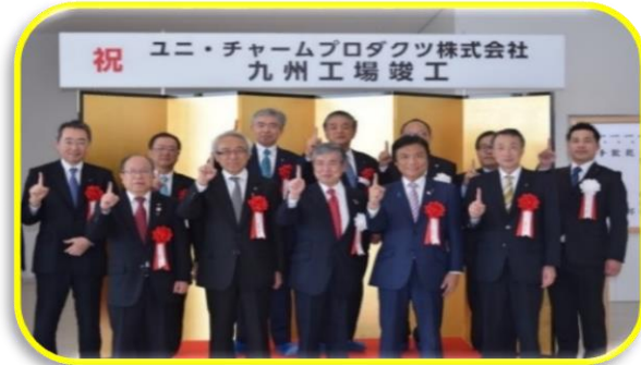
●竣工奉告祭の様子