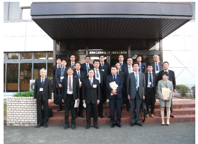
・機械電子研究所