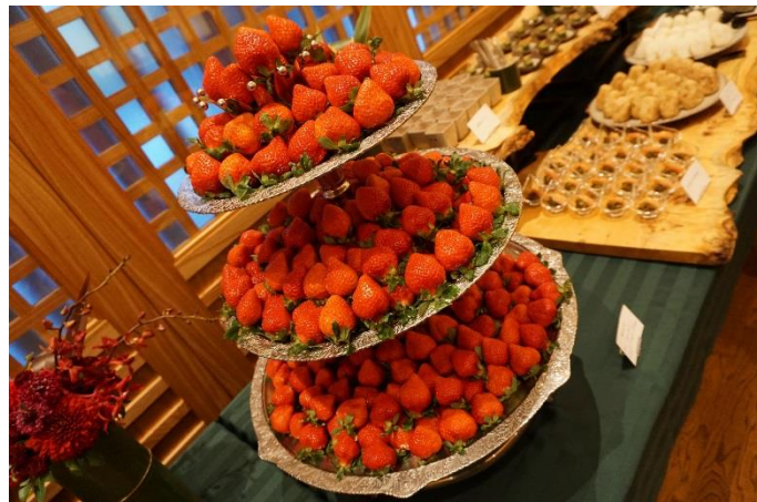
●提供された料理 いちごの王様「あまおう」