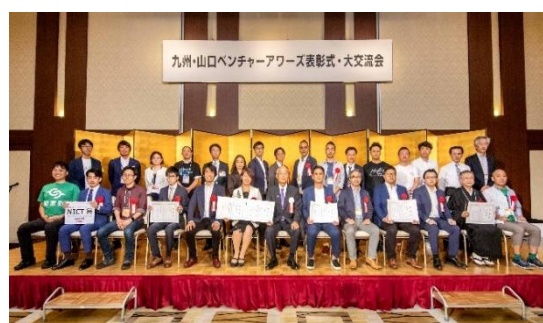
●九州・山口ベンチャーアワーズ発表企業・審査員の方々