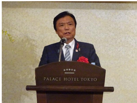
● 県政報告を行う知事(11月22日/東京)

知事は、11月2日に閉幕したラグビーワールドカップ2019日本大会における福岡県の成果を述べるとともに、「第4次産業革命」への対応、「100年グッドライフ福岡県」の構築に係る取組など、本県の主要施策について報告しました。