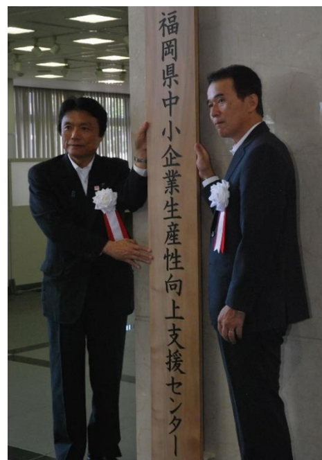
●（左から）知事、安松センター長

http://www.pref.fukuoka.lg.jp （「福岡県生産性向上」で検索）