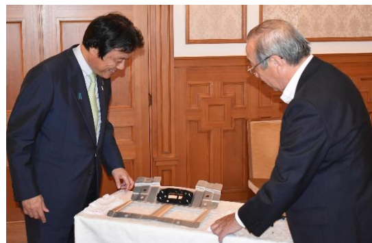
● 小川社長から製品の説明を受ける知事