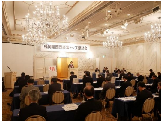
● 懇談会の様子(11月18日/大阪)