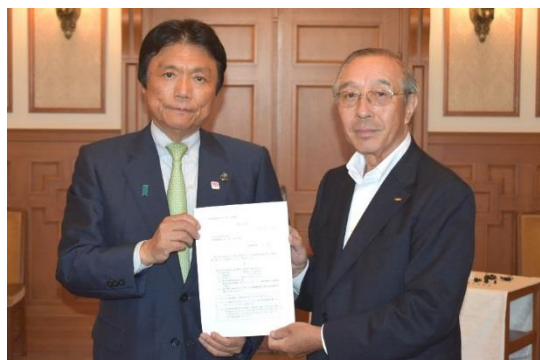
● (左から) 知事、太平洋工業株式会社 小川代表取締役社長

知事は、「北部九州の自動車産業のさらなる発展にご貢献いただき、大変心強く思っております。できる限りの支援をさせていただきます」と述べました。