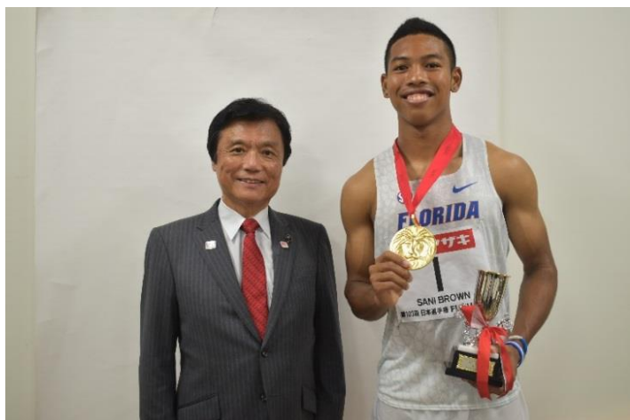
●男子100メートル、200メートルを制した サニブラウン アブデルハキーム選手と