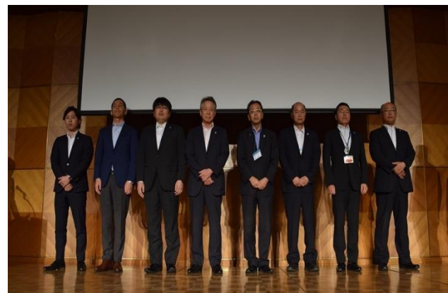
●企業グループ「FAIN」紹介の様子