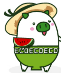
福岡県広報部長 「エコトン」

TEL:052-890-9055 FAX:052-890-9056 E-mail:nagoya-o@pref.fukuoka.lg.jp