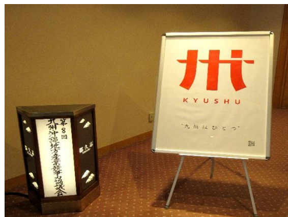
●会場に「九州はひとつ」を表す九州ロゴマーク(写真右)を掲示