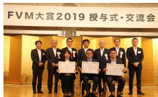
●FVM大賞2019授与式の様子

5月20日、福岡市で令和元年度FVB協議会・福岡ベンチャークラブ総会・FVM大賞2019授与式を開催しました。