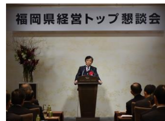
(写真)県政報告を行う知事

加えて、人口減少対策や地方創生の取り組み、グリーンアジア国際戦略総合特区の推進、今後さらなる成長が期待できる自動車産業やIoT技術を活用した取り組み、県産農林水産物のブランド化・輸出強化、交通インフラの充実など、本県の主要施策について説明しました。