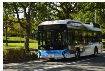
(写真)試乗会で走行する「トヨタFCバス」