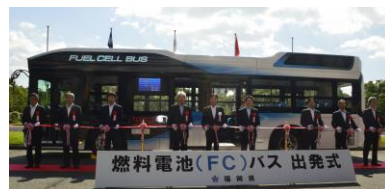
(写真)テープカットの様子

その後、知事は来賓とともにFCバスに試乗し、FCバスのクリーンで静かな乗り心地を確認しました。