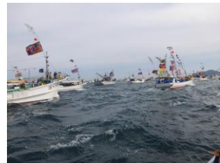
(写真)「みあれ祭」の様子