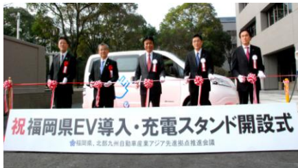
(写真)テープカットの様子

県では、電気自動車(EV)など次世代自動車の普及とそのインフラ整備を一体的に進めています。3月8日、日産自動車の新型EVバン「e-NV200」をモニタリングするため、保健環境研究所に公用車として導入するとともに、県庁にEV用急速充電スタンドを設置、その導入・開設式を行いました。知事は、今回導入したEV公用車について、「大いに活用し、EVならではの活用方法のモデルとなり、さらなる普及につながることを期待します」、また、県庁充電スタンドについて、「EVユーザーの方ならどなたでもご利用いただけます。ぜひ、多くの方にEVで県庁に来ていただきたいと思っています」と挨拶しました。