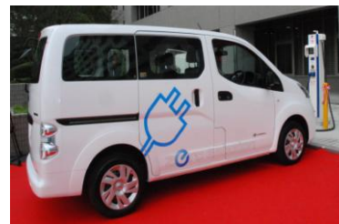
(写真)EV公用車と県庁充電スタンド