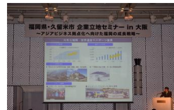
(写真)福岡県・久留米市 企業立地セミナーin大阪の 様子

また、支援制度を活用して設備投資に取り組んでいるダイハツ工業株式会社から「九州開発センターでの新技術・人づくりへの取組み」について、東プレ九州株式会社から昨年稼働した工場での「東プレ九州の取組み」について講演が行われ、満員の会場は熱気に包まれました。