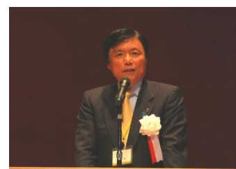
(写真)挨拶する小川知事

出席した知事は、県の水素・燃料電池分野に対する取り組みを紹介するとともに、「水素・燃料電池の利用を飛躍的に進め、我が国の大きな産業の柱に育てなければなりません。これからの10年が正念場です。本県としましては、水素・燃料電池の市場・普及の拡大と産業化の推進にこれまで以上に力を入れてまいりたいと考えております」と挨拶しました。