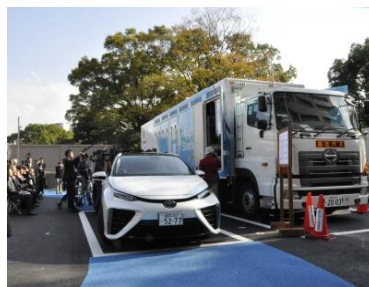
(写真)移動式水素ステーションとFCV