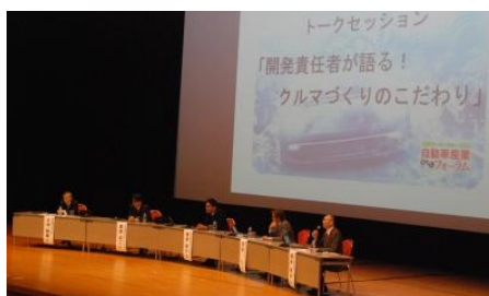
(写真)トークセッションの様子