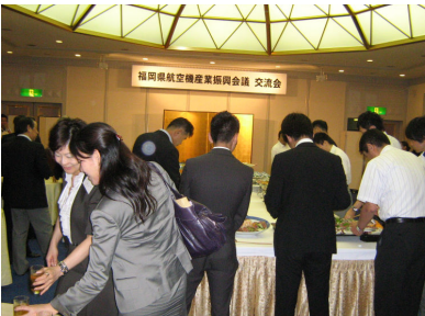
昨年の様子 (講演会とその後の交流会の様子)