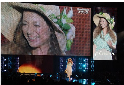
福岡企業とのコラボ作品で登場したタレントのスザンヌ

3月25日、福岡市の福岡国際センターで九州地区最大級のファッションイベント「福岡アジアコレクション(FACo)2012」が開催されました。アジアにおけるファッション産業拠点「福岡」を目指し、ファッション関連企業・学校、行政等で構成する「福岡アジアファッション拠点推進会議」が主催するもので、今回で4回目です。