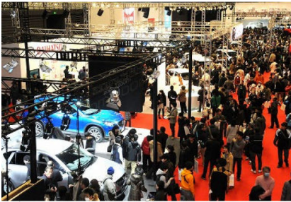
多くの来客で賑わう「福岡モーターショー2012」の会場

「福岡モーターショー2012」が、1月27日から30日までの4日間、福岡市博多区のマリンメッセ福岡など3会場で開催されました。3回目となる今回は、「クルマと夢見るあしたの暮らし」をテーマに、コンセプトカーや最新市販車など、国内外から、これまでで最大の34ブランド、223台が出展され、4日間で過去最多の14万人が来場しました。